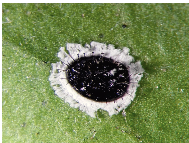
Fig. 3 – Spine filamentose intorno al corpo.