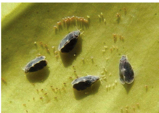
Fig. 1 – Adulti di Aleurocanthus spiniferus e uova.

L'insetto è dotato di apparato boccale pungente-succhiante, con il quale si nutre della linfa sia negli stadi giovanili, che da adulto. Si sviluppa in dense colonie sulla pagina inferiore delle foglie ed espelle una grande quantità di melata appiccicosa, che imbratta la vegetazione e sulla quale si sviluppa la fumaggine, una muffa saprofita nerastra (Figura 4). Ne consegue un deperimento delle piante dovuto, oltre all'attività di alimentazione, alla riduzione della respirazione e dell'attività fotosintetica. La melata può percolare sui frutti riducendone il valore commerciale.