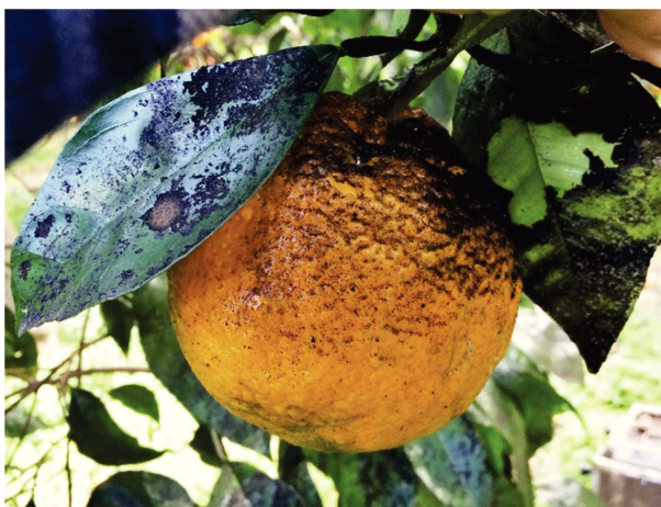
Fig. 4 – Fumaggine su foglie e frutto di arancio.

Gli adulti non sono dei buoni volatori e si spostano a brevi distanze se sono disturbati, ma il loro spostamento è favorito dal vento e, a grandi distanze, avviene con il trasporto di piante o materiale vegetale infestati. Questo aleurodide infesta in prevalenza gli agrumi, ma può attaccare altre piante agrarie e su ornamentali (quali piracanta, rosa, edera, ecc.) le infestazioni possono essere frequenti,